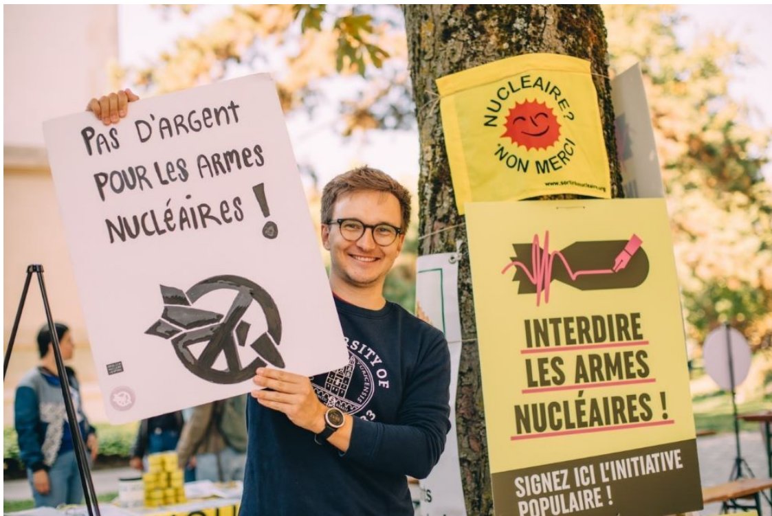
Genf sagt: Kein Geld für nukleare Waffen, unterzeichnet Treaty on the Prohibition of Nuclear Weapons (TPNW)!, Foto: ICAN | Aude Catimel

auch Geld an in Firmen, die an der Herstellung von Anti-Personenminen, Clusterbomben und nuklearen Sprengköpfen beteiligt waren. Laut dem Kriegsmaterialgesetz der Schweiz ist die „direkte und indirekte Finanzierung“ von verbotenen Kriegsmaterial jedoch klar untersagt. Verbotene Waffen sind in der Schweiz chemische und biologische Waffen, Atombomben, Streubomben und Antipersonen-Minen.