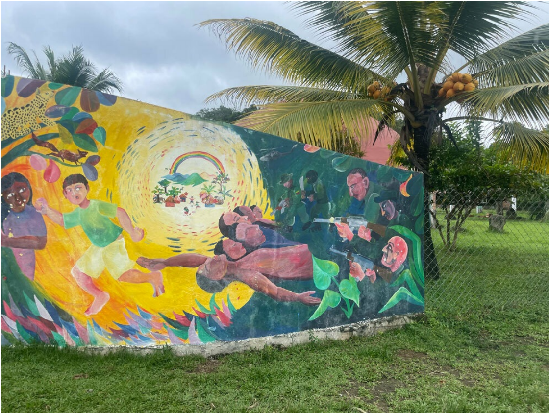
Malerei an einer Mauer um den zentralen und spirituellen Ort der Friedensgemeinschaft von San José

Wer hier die Banditen sind, vermag ich nicht zu sagen. Paramilitärs, Militärs, Guerrilla. Der Staat, die Polizei, die Staatsanwaltschaft. Laut Gesetz und Verfassung ist das Land eine Demokratie. In der Praxis blickt kaum jemand durch, genießen Verbrecher völlige Straffreiheit ( https://www.manova.news/artikel/der-gewalt-ausgeliefert ). Bei einer Ausschreitung im Jahr 1948 in der Hauptstadt Bogotá, nachdem der sozialistische Politiker und Anwalt Jorge Eliécer Gaitán ermordet wurde, verteilten „in einem Viertel im Zentrum der Stadt Polizisten Waffen an die Demonstranten. In anderen Vierteln beschossen sie sie mit Gewehren“ (3).