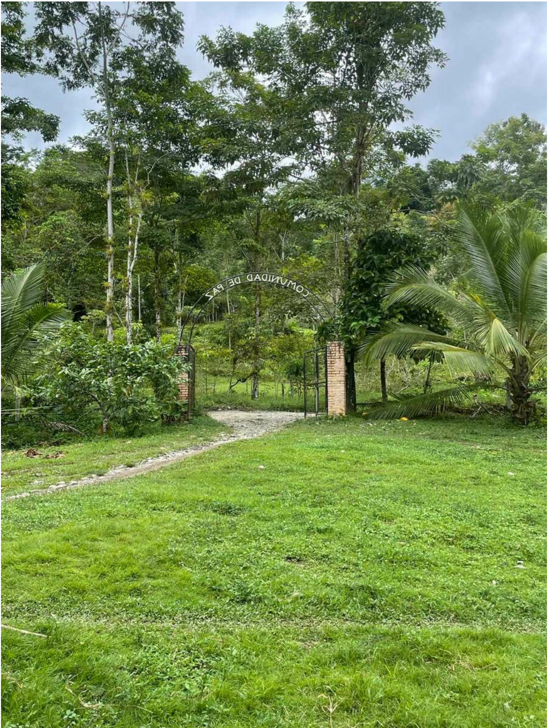
Blick von unserer Terrasse auf das Eingangstor zur Friedensgemeinschaft von San José

Vor unserer Terrasse der verschwenderische Reichtum der Natur. Üppiges Grün, ab und zu frei laufende Pferde oder Hühner auf dem Rasen. Eine latente Bedrohung liegt in der Luft, nur eben nicht für unser Leben. Die bedrohten Leute